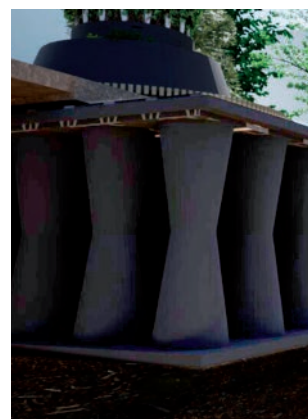
TANQUE DE TORMENTAS