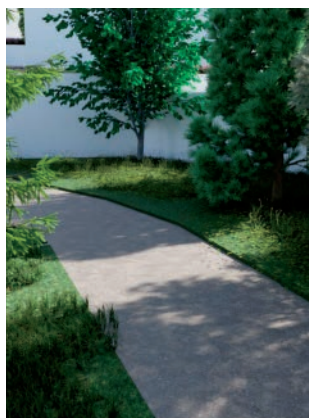
SUELO ECO ESTABLE